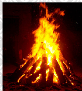
nu sibi (la lumbre)