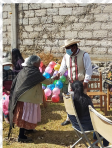
kjimi (buenos días)