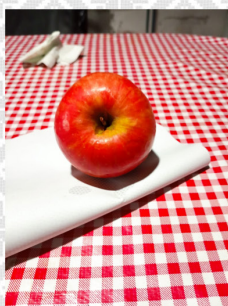
ne ixi (la manzana)

Le agregamos el artículo el y la y repitamos la lectura.