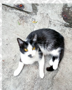
nu mixi (el gato)