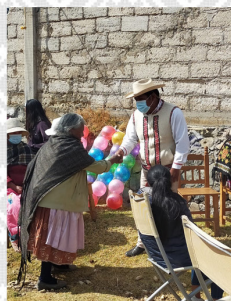
kjimi (el saludo)