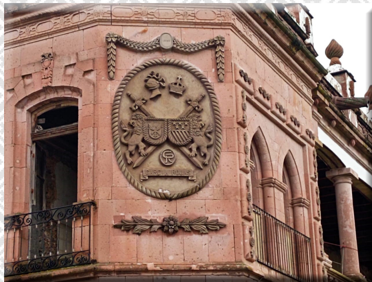
Fotografía: Escudo de Armas en la Hacienda la Providencia