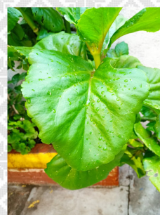
ne xii (la hoja)