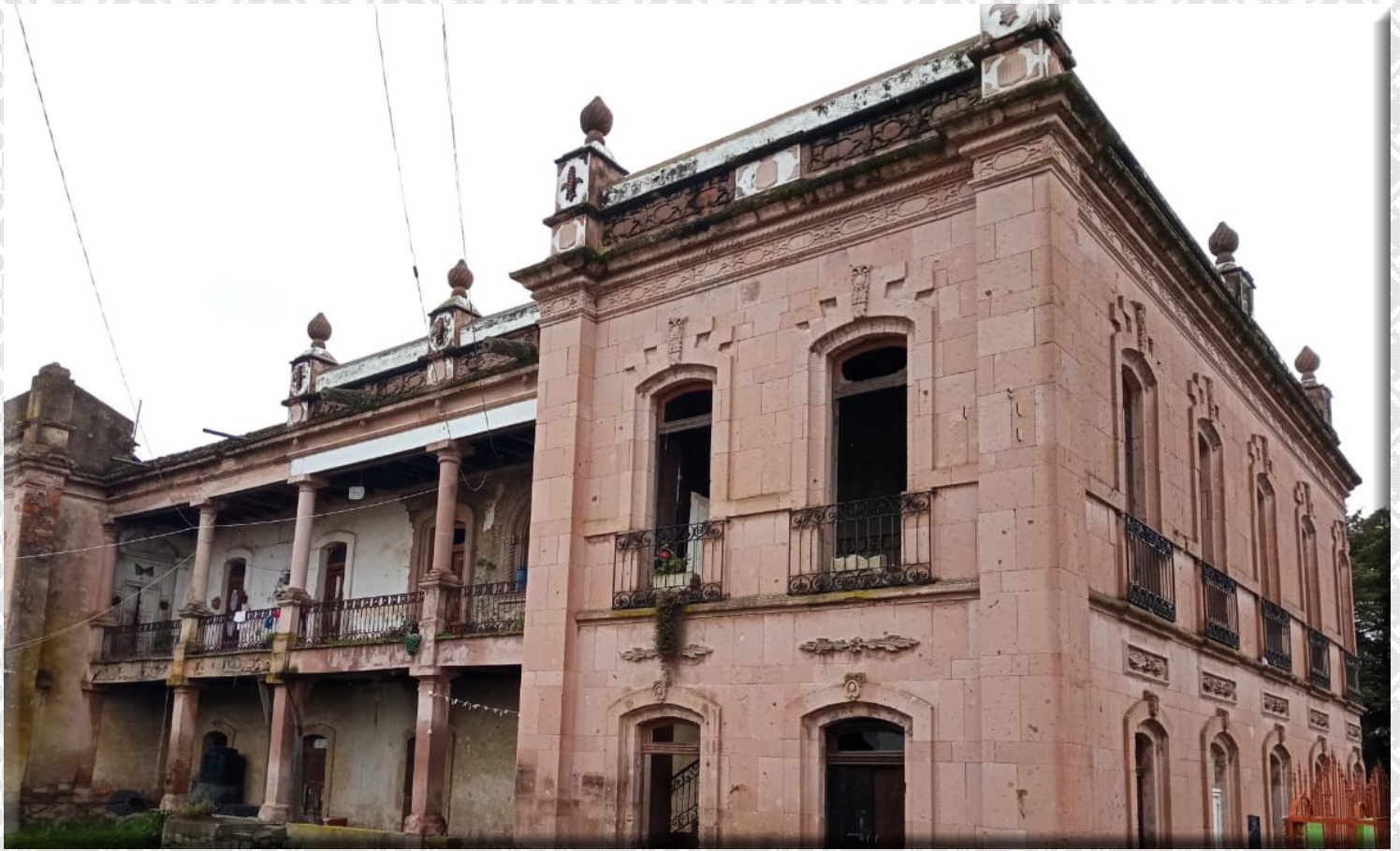
Fotografía: Hacienda la Providencia